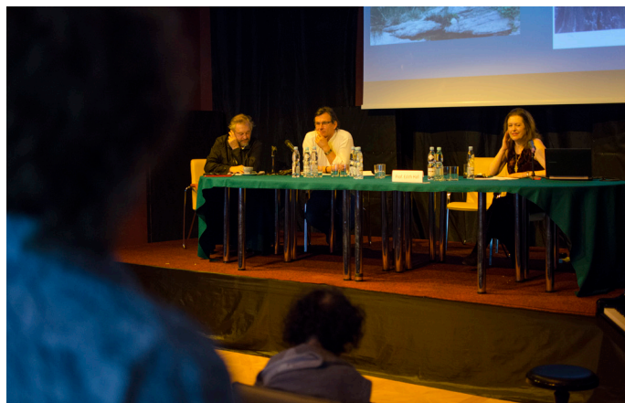
2017.05 Konferencja Eurypides II.

17.30 – 19.00 Wykład Armanda D'Angour: Ożywiający Orestesa: dźwięki Chóru, połączony z prezentacją rekonstrukcji Orestesa Armanda D'Angour – aktorzy i muzycy Teatru Gardzienice z udziałem Macieja Rychłego; Prowadzenie: Włodzimierz Staniewski