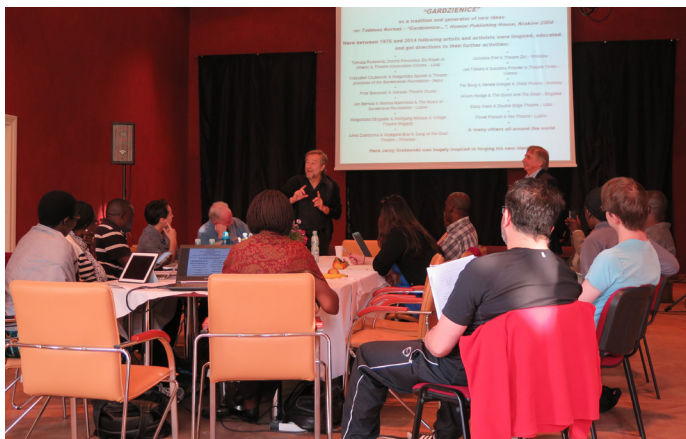
Theatre for Conflict Resolution. _Konferencja afrykańska_, 2014.

Kurator: Włodzimierz Staniewski (Dyrektor OPT „Gardzience”)