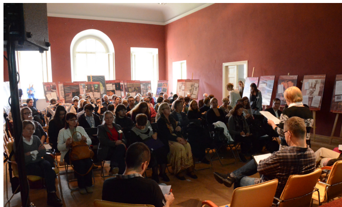
Zjazd Teatrologów w Gardzienicach.

21.00 - Premiera Oratorium Pytyjskiego autorstwa Włodzimirza Staniewskiego z muzyką Mikołaja Blajdy w wykonaniu krakowskiej orkiestry Orient Express Orchestra