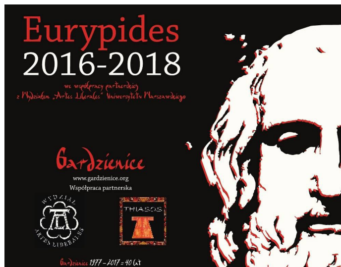
Eurypides - innowator. 2016-2018

16.00 – 16.45 Teatr Thiasos: warsztaty i pokazy tańców tradycyjnych z muzyką na żywo i wizualizacjami