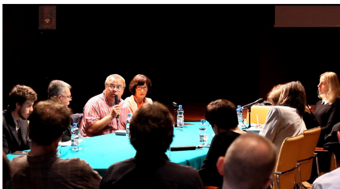
Sentio Novalis, symposium. Gardzienice 2015