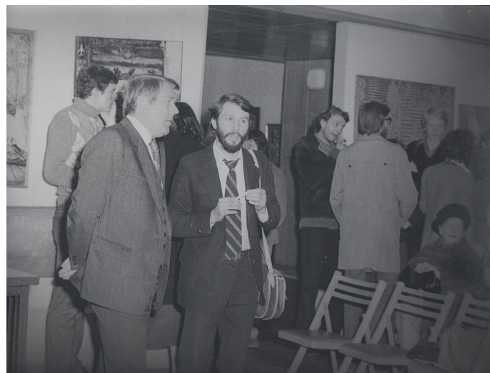
Międzynarodowe Sympozjum TEATR WOBEC TRADYCJI LUDOWYCH, Lublin 1979.

Wystąpienia, dyskusje i spotkania robocze odbywać się będą w Muzeum na Zamku w salach konferencyjnej i ekspozycyjnej. Zdarzenia towarzyszące – na dziedzińcu Zamku i, przy sprzyjających okolicznościach, poza Lublinem.