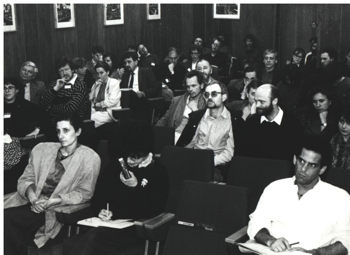
Seminarium polsko-szwedzkie, 1991.

13.00 – Biesiada z wykładami o oracjach (dla uczestników i zaproszonych gości)