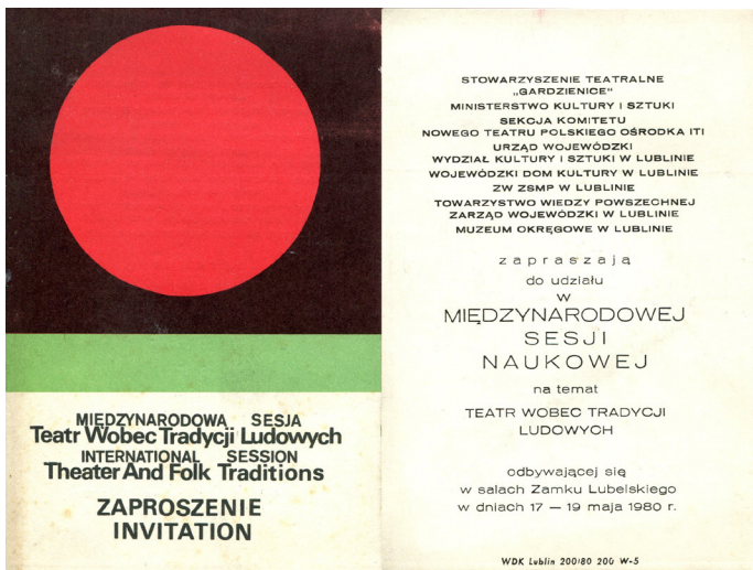
Teatr wobec tradycji ludowych - zaproszenie